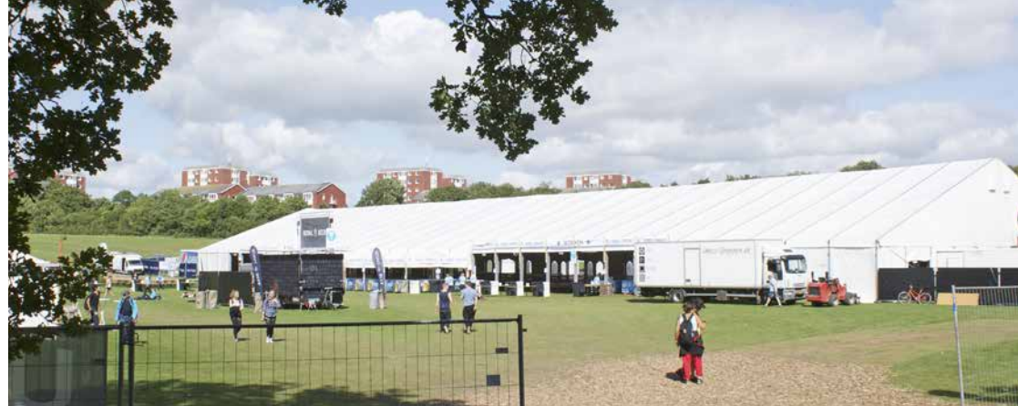
Ett av flera serveringstält i samma storlek.

Naturligtvis avrundades det hela med en avslutningsshow under söndagen, helt i stil med OS. Men då hade jag redan lämnat Esbjerg för skytteuppdrag på hemmaplan. Nu har energin sänts vidare till Aalborg inför 2017. ■