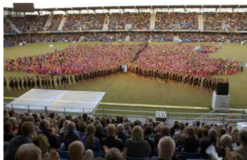
International Gym. Night, en sommerful (fjäril) på arenan.

I Danmark skapades traditionen med Landsstævner 1862 genom en prisskjutning i Köpenhamn, mot bakgrund av att Danmark skulle vinna tillbaka det tidigare förlorade Sønderjylland! Ganska snart kom även gymnastiken med i arrangemangen. Som en följd av första världskriget blev Sønderjylland åter danskt, något som ingen trott var möjligt. Så under mellankrigsåren gick skyttar och gymnaster skilda vägar. Stävnerna levde kvar och efter andra världskriget ändrade de karaktär. Utöver skytte och gymnastik kom nu även bollspel och andra idrotter med. 1971 arrangerades gymnastikuppvisningar och folkdans i Holstebro centrum, som gjorde att befolkningen kunde delta. Med fest och underhållning blev detta succé och medverkade till utformningen av dagens stævner som blivit en stor folkfest. Under en period har skytte och övriga organisationer gått skilda vägar, men samhörigheten har funnits ibland annat Landsstävnerna, och nu är man åter samlade i en organisation.