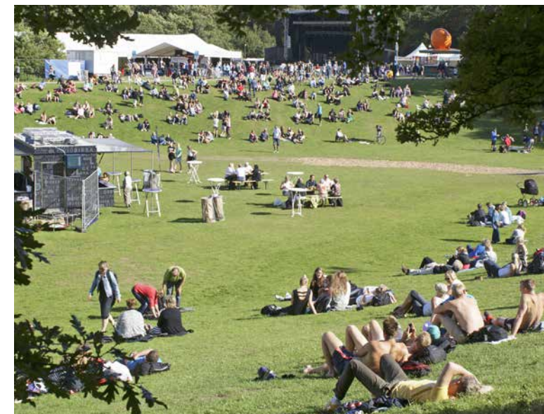
"Gryden" centrum för fest och underhållning.