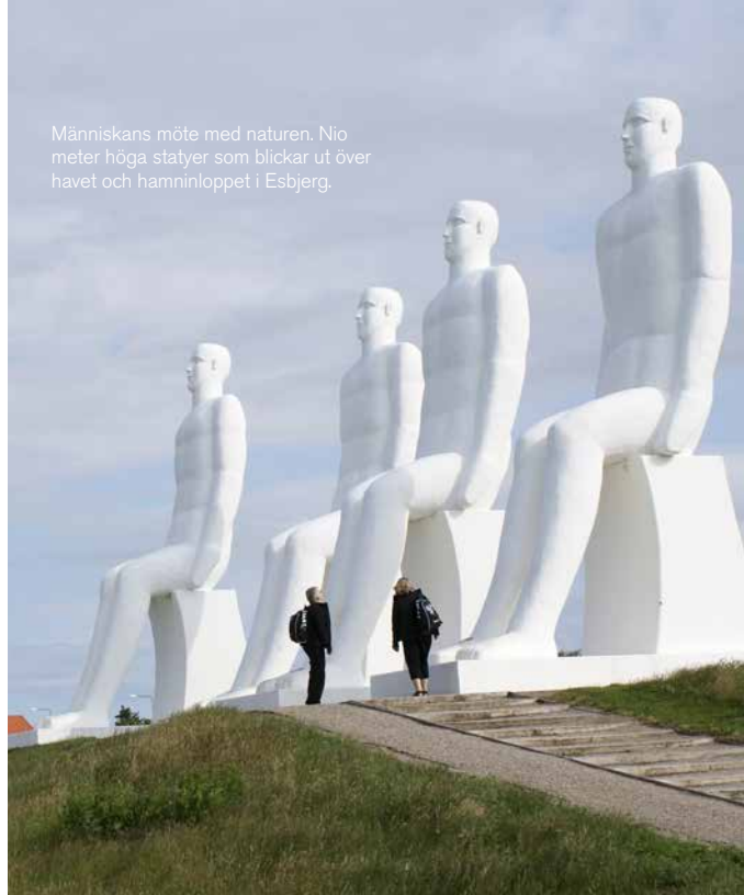
Människans möte med naturen. Nio meter höga statyer som blickar ut över havet och hamninloppet i Esbjerg.

Staden präglas naturligtvis helt av detta jättearrangemang, med bland annat avstängda gator i de centrala delarna under de här dagarna. Alla fria ytor fylls med