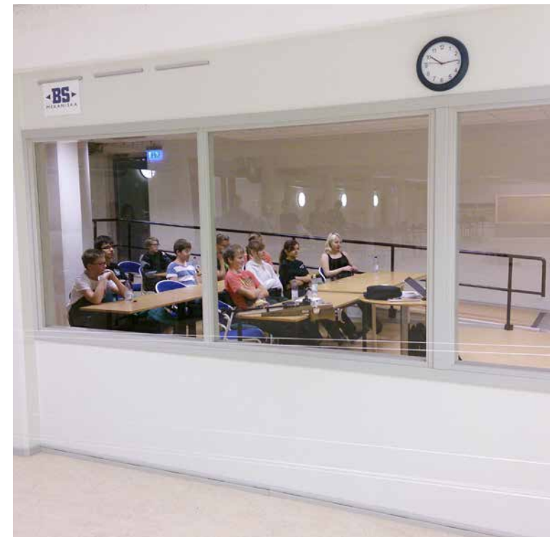
Teori för luftgevärsskyttarna.