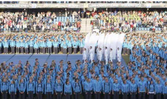
Efterskolen har intagit arenan.