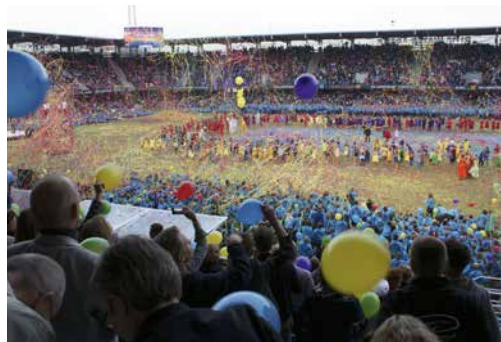
Energien släpps lös - färgspragande avslutning.