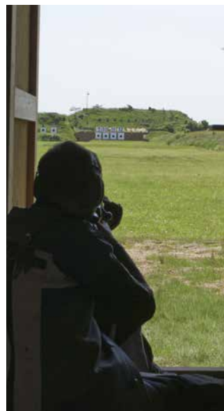
200 m gevär 6,5.