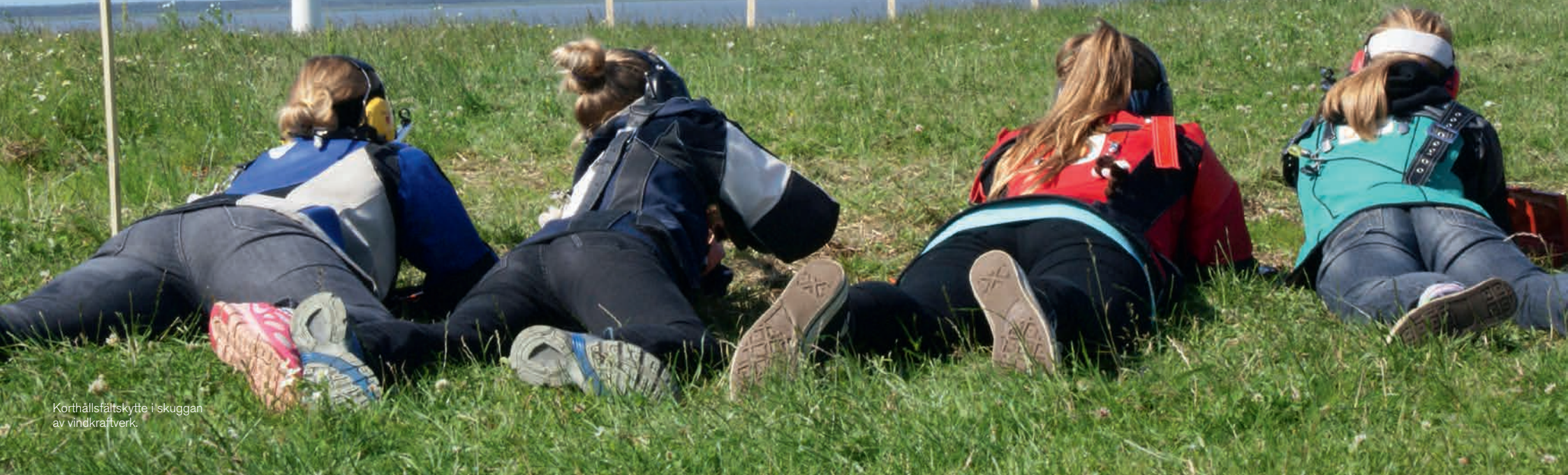
Korthållsfältskytte i skuggan av vindkraftverk.