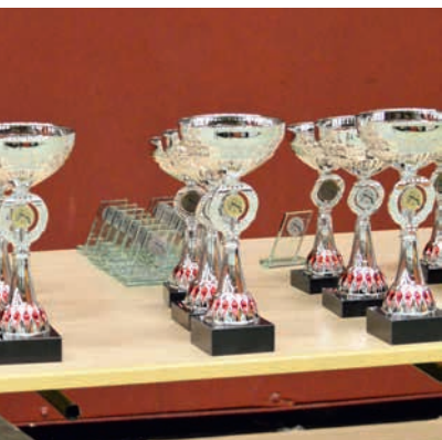
Söndagens prisbord, totalt 182 st priser delades ut till ungdomarna under två dagar.

Helgen den 16-17 november firade tävlingen Göta Kanal Masters i Töreboda fem-årsjubileum. Arrangörerna Töreboda PSK och Fredsberg-Älgårås SKG berättar med stolthet att tävlingen nu har genomförts under fem år i den nuvarande formen, på elektroniska tavlor och med pistol- och gevärsskyttar skjutandes sida vid sida.