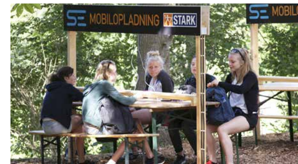
En viktig funktion, mobiluppladdning.