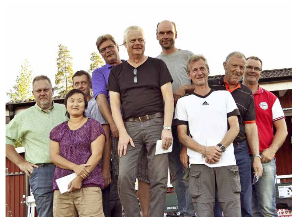
Gnosjö Jvf. Växjö Jsk. Gamleby Jsk.