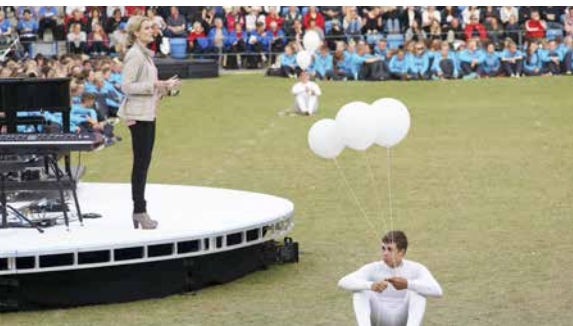
Statsministern håller invigningstal.