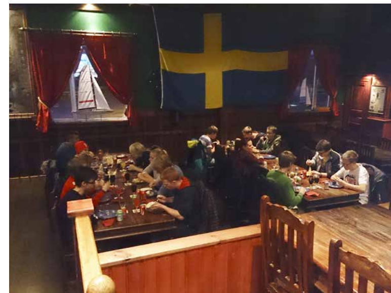
Tacobuffé på lördagskvällen.