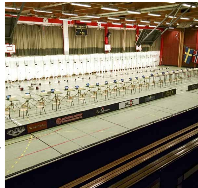
Nååååstän hela tävlingshallen.