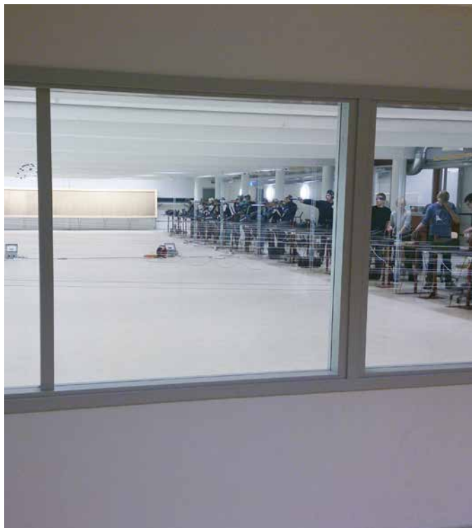
Träning i lufthallen.

Avslutningsvis bör nämnas, som trevlig och sporrande kuriositet, att åldern på de fyra ledare som deltog under lägret låg mellan 22 och 25 år, samt att två av dessa ingår i styrelsen för pistolsektionen i Västergötlands Skyttesportförbund. Ett gott tecken på förnyelse inom skyttet! ■