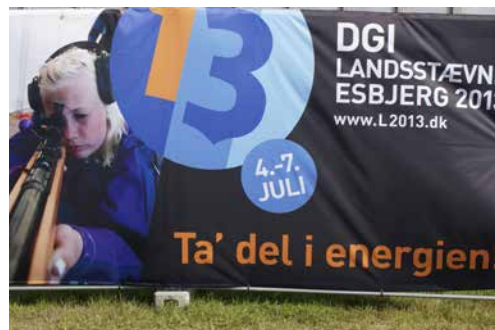
Reklam för skytte på landsstævnen.