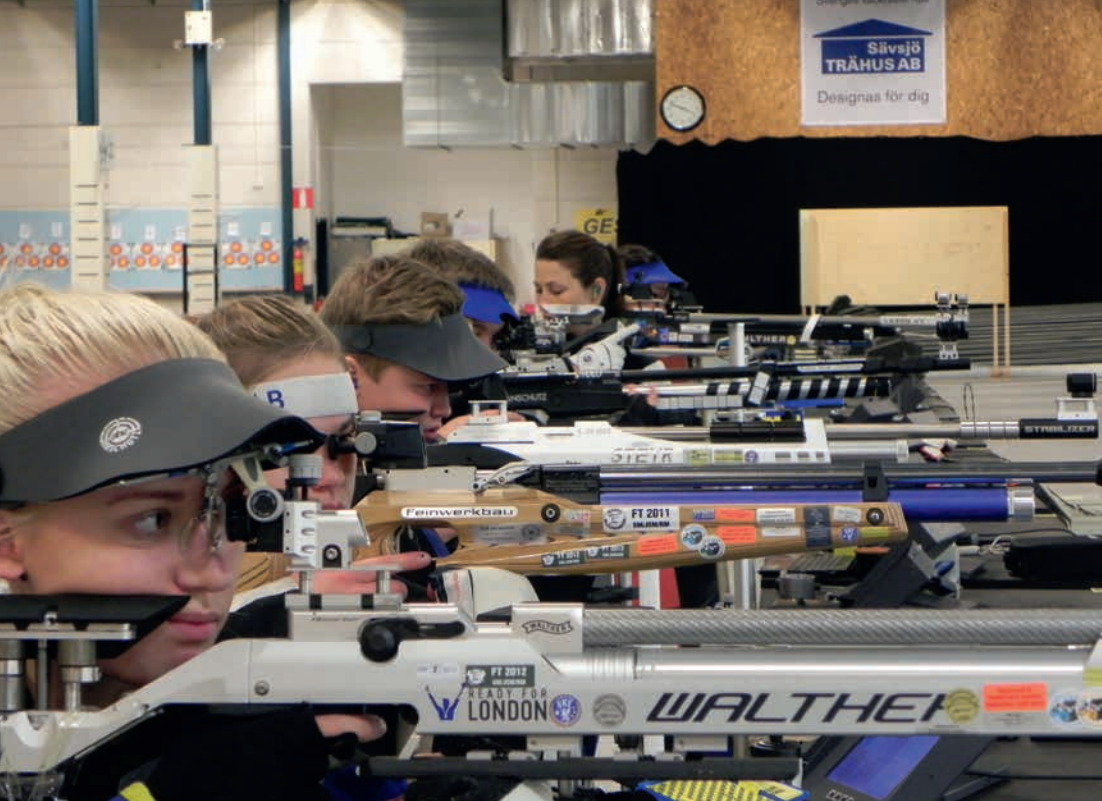
Man kunde nästan ta på fokuseringen i lufthallen.