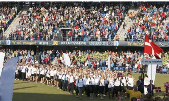
Inmarschen till invigningsceremonin.