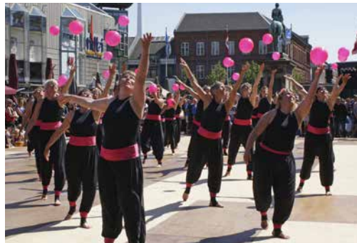
Gymnastikuppvisning på ett torg.