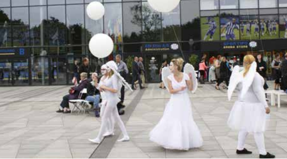
Upptredanden vid tävlingscentrum.