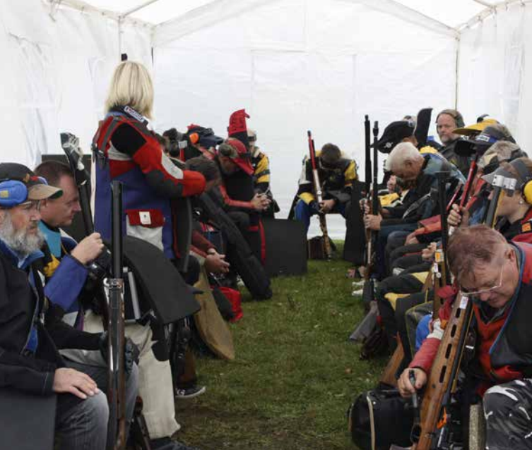
I väntan på skjutning.