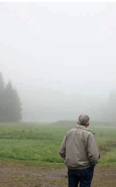
Den värmländska dimman var närvarande.