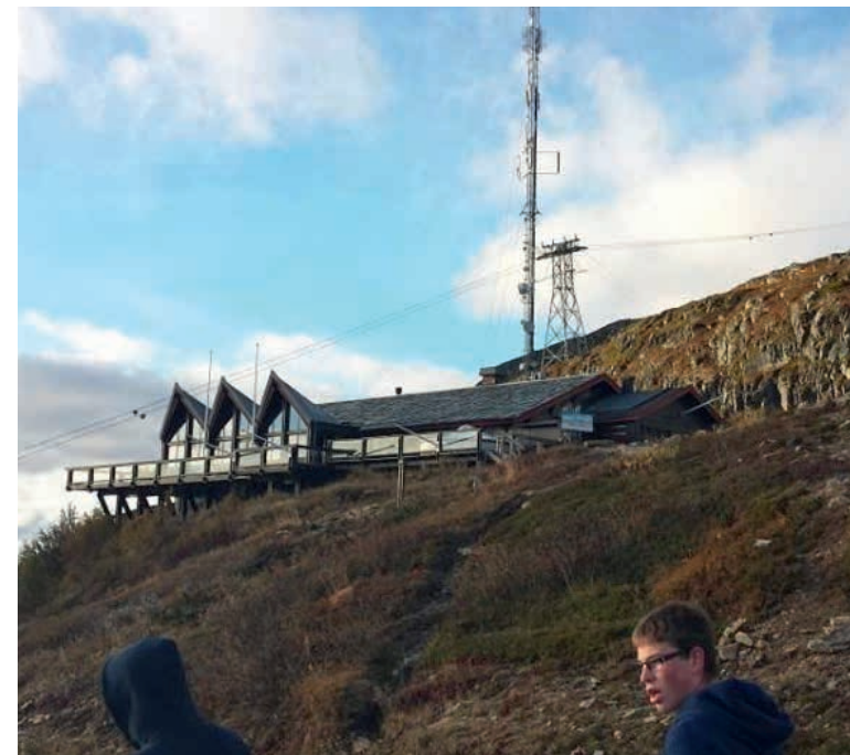
Uppe på toppen.