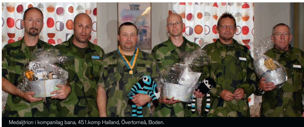
Medaljtrion i kompanilag bana, 451.komp Halland, Övertorneå, Boden.