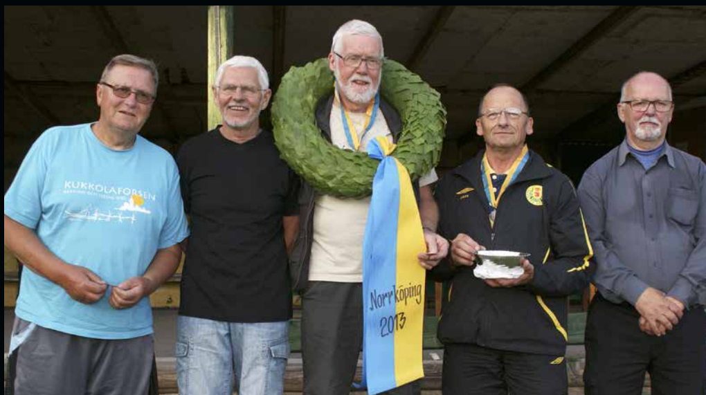
Veteran-SM ställning förbundslag: segrande lag Skåne.

götland på 222 träff. Svenska veteranmästare förbundslag blev Västmanland på 224 träff, silver till Västsvenska 218 och bronset erövrades av Östergötland som fick 217 träffar.