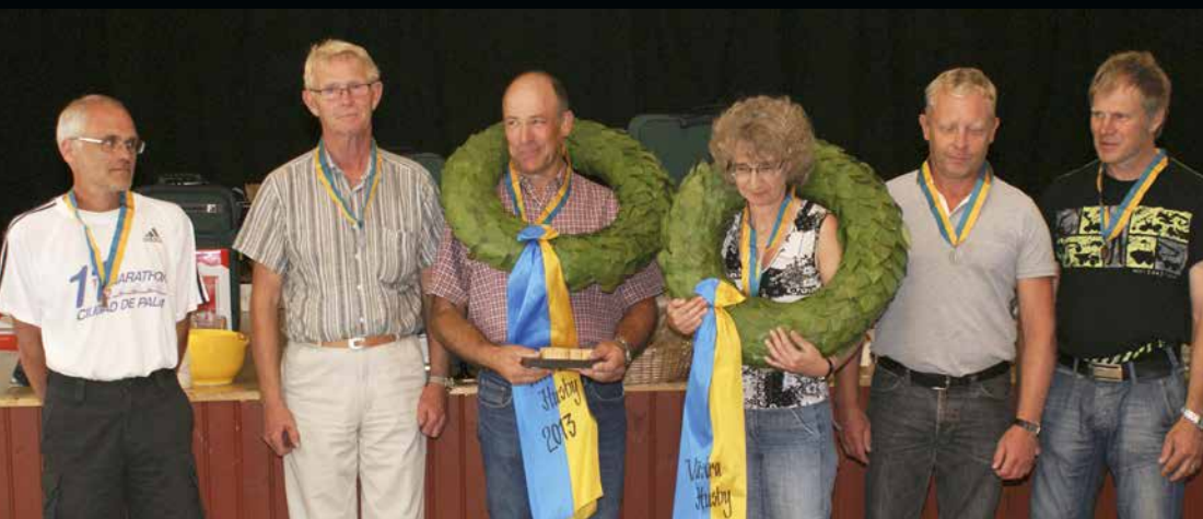
Alla medaljörer i fältskytte.

► i ett tävlingsarrangemang som genomfördes på ett utmärkt sätt.