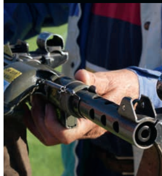
Vänstermontage av riktmedel.

Som vanligt under senare år var det svårt att hitta arrangör för årets kpist-SM. Östergötland tillfrågades och var tveksamma med anledning av otillräcklig bankkapacitet och osäkerhet gällande terräng för fältskytte. Efter kort betänketid kom dock ett ja. Därmed be-sannades den gamla tesen "vill man, så går det". Dessutom blev det riktigt bra, med mycket välplanerade och väl genomförda tävlingar.