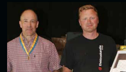
SM fält föreningslag: Segrande lag Gullbergs härads skg.