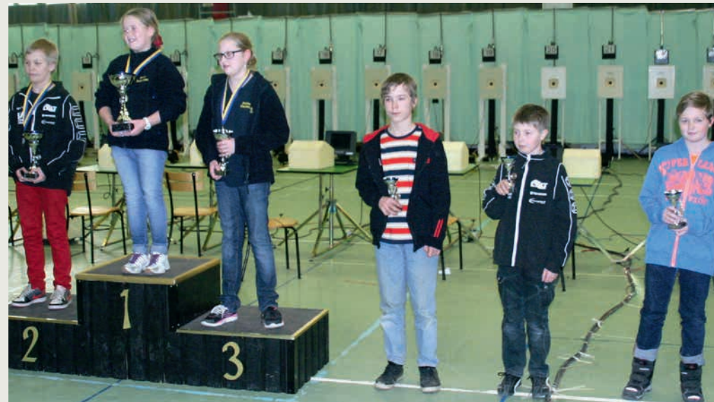
På bilden ser vi pristagare i årets klass Lp11.

Planera sedan in upp till tre kvaltävlingar i varje distrikt (fyra i Norr- och Västerbotten), där den sista räknas som Distriktsfinal. Regionansvarig beställer medaljer och dekaler av undertecknad inför finalerna. Det är naturligtvis roligast för skyttarna att samlas på större tävlingar, men i mindre distrikt kan ett kval enkelt arrangeras en vardagskväll. Det viktiga är att inbjudan finns ute i sektionens tävlingsprogram i god tid, då många skyttar vill resa