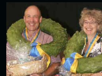
Mästarna i Veteran-SM och SM fältskytte.

Därmed återstår bara att tacka för bra SM-arrangemang. Vi ser alla fram mot att åter träffas i samband med denna skyttehögtid under 2014. Var detta blir är i skrivande stund dock inte klart. ■