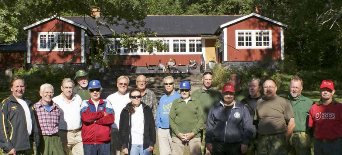
Skåneskyttar framför Norrköpings skyttekilles storslagna klubbhus.