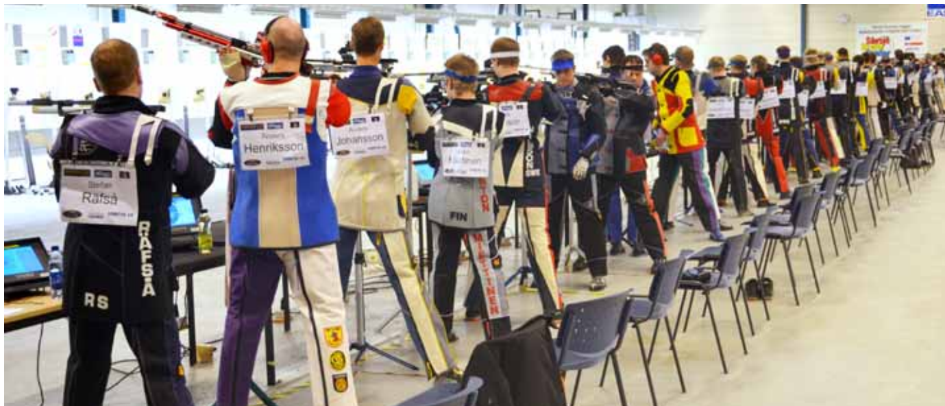
Många gevärsskyttar deltog.

Första dagen släppte han i gen-gäld finalsegern till norrmannen