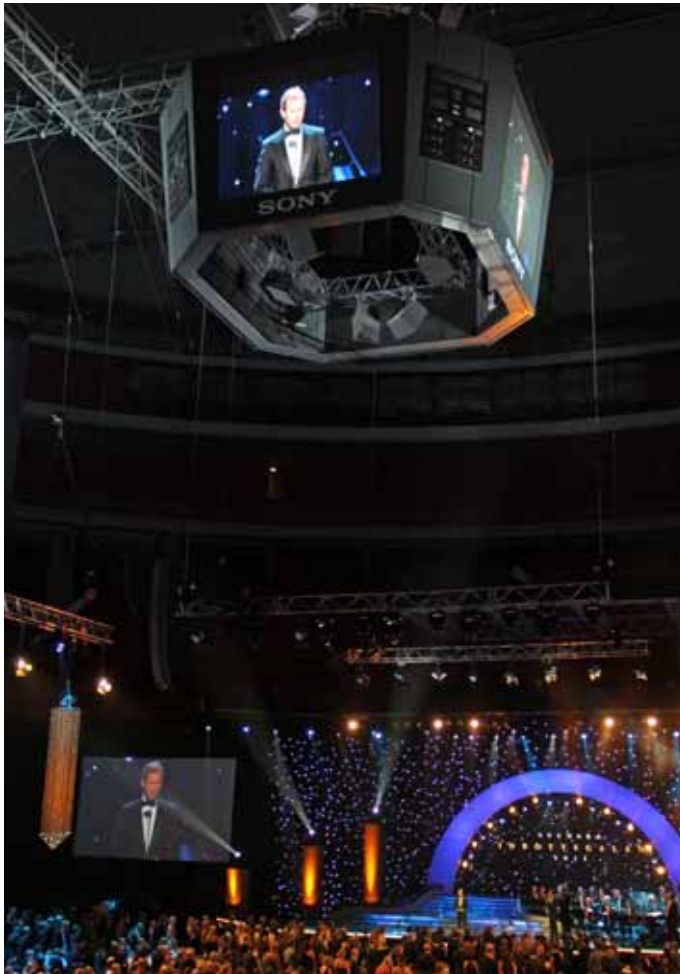
Ryttaren Rolf-Göran Bengtsson tackar för Jerringpriset.