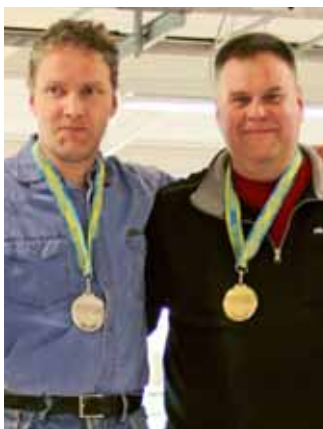
Hej från pallen.