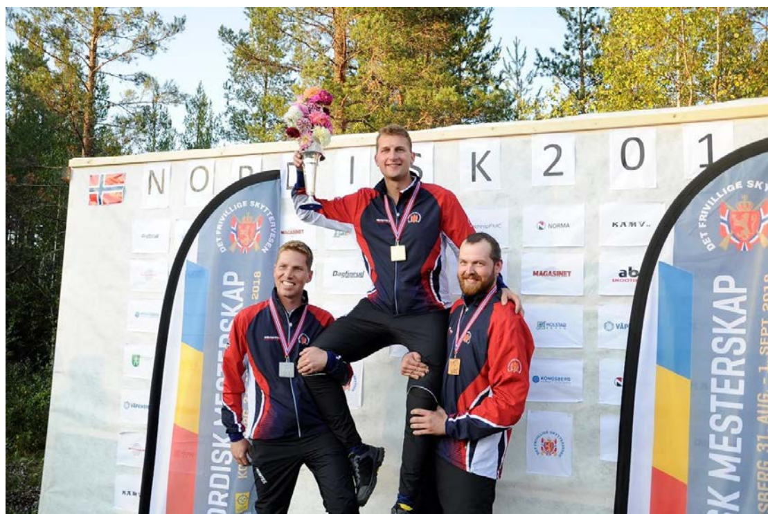
Skytterne med pallplass fra mesterskapet.