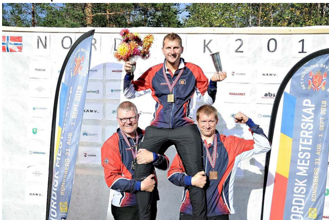
Skytterne med pallplass fra mesterskapet.