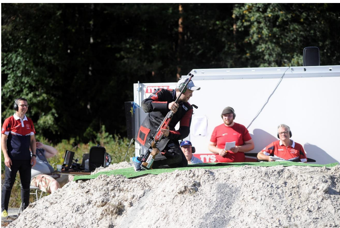
Flott vær preget årets mesterskap. Her fra felthurtigskytingen.