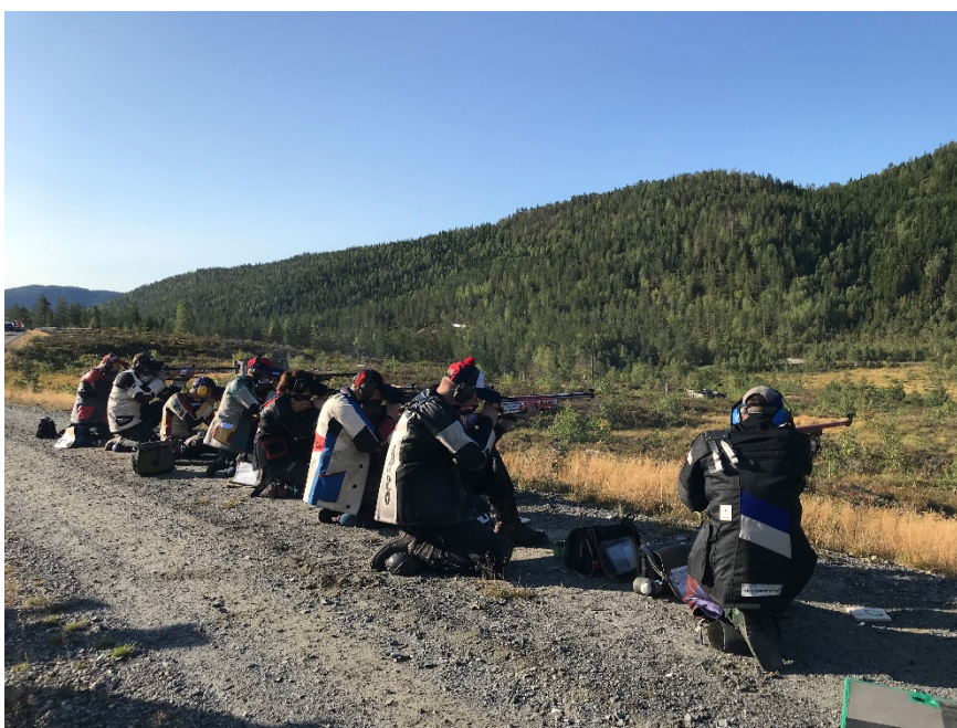
Fra feltrunden på Hengsvann.